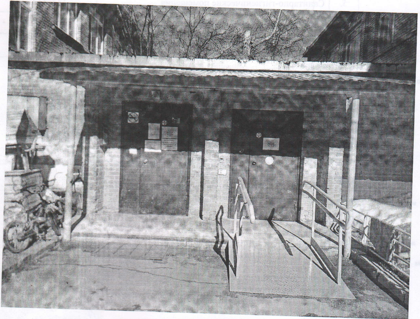
Фото №1. Пандус на входной группе

Приложение к Акту выполненных работ по адаптации объекта и повышению уровня доступности образования для людей с инвалидностью и маломобильным группам населения (МГН) в период с 2018 по 2023 годы к паспорту доступности ОСИ № 1 от 01.11.2019 года